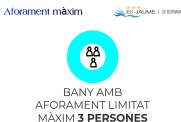
Figura 2. Exemple de senyalització d'aforament màxim.