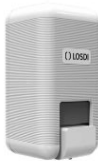
Figura 5. Dispensador de gel hidroalcohòlic.