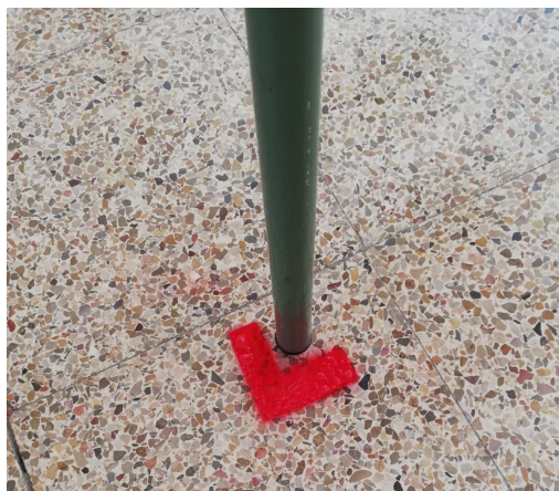
Figura 6. Senyalització de la taula (pota superior dreta).