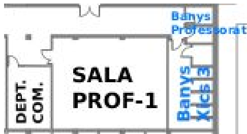
Figura 3. Sala professorat - 1.