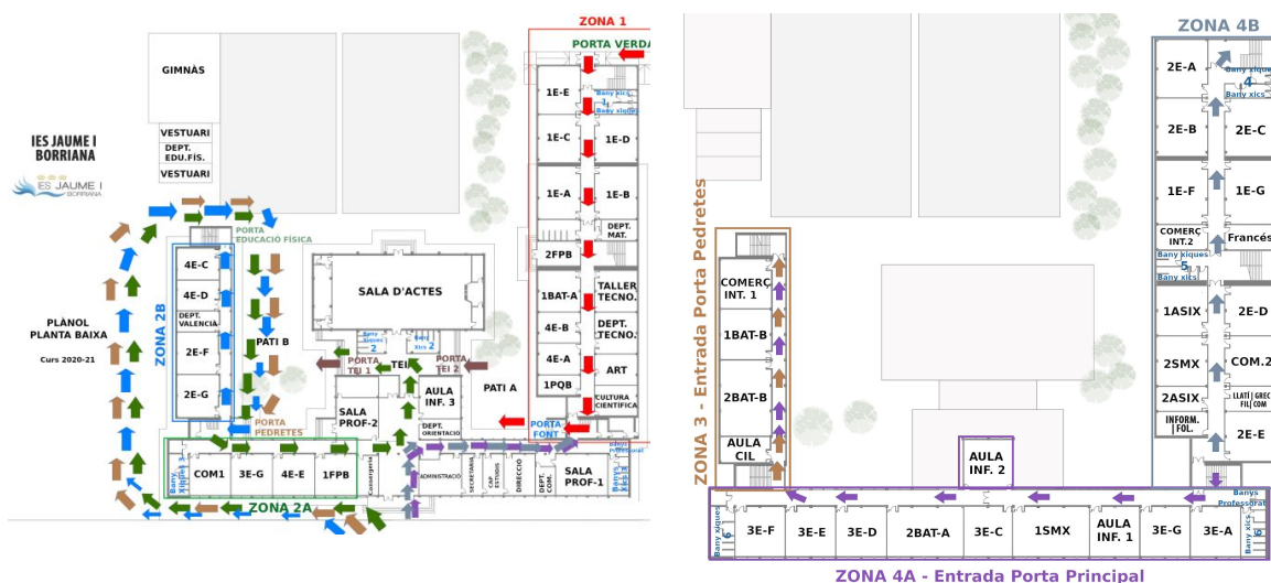
Figura 1. Plànols de direccions.

Les entrades i eixides es delimiten per zones. Cadascuna d'elles tindrà un accés d'entrada i un altre d'eixida. La direcció de les fletxes indiquen el sentit de circulació de l'alumnat i professorat . L'aparcament d'automòbils estarà inhabilitat perquè serà un dels accessos de l'alumnat enguany.